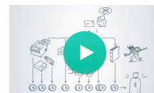
Business output - the next way

Mail ansøgning/CV til job@multi-support.com . Kig også forbi multi-support.com og få et indtryk af den professionalisme, vi kommunikerer og leverer til vores kunder.